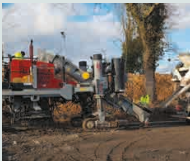
Matériel d'entreprise pour le chantier voirie lotissement « Terre Bourlotte ».