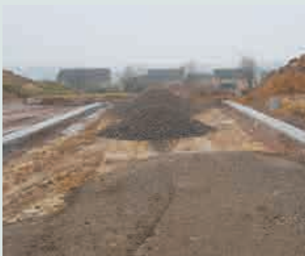
Travaux préalables à l'asphaltage de la voirie lotissement « Terre Bourlotte »