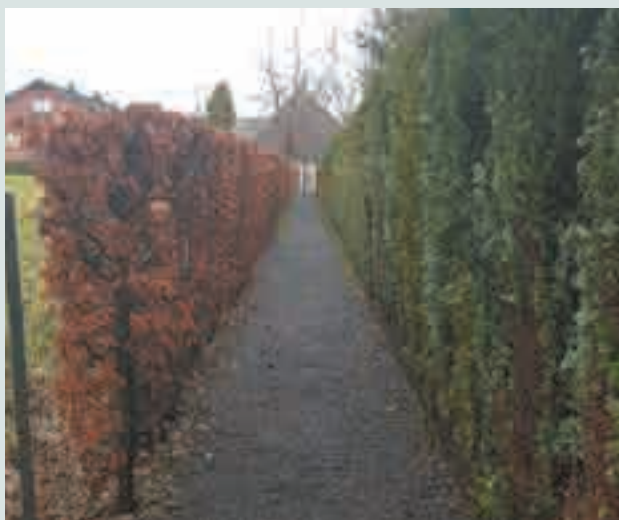
Ré empierrement d'un sentier à Scry suite à la demande de riverains