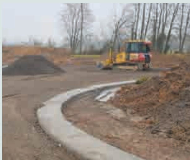
Coulage des bordures en béton – lotissement « Terre Bourlotte »