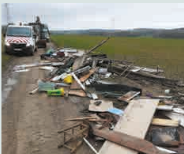
Évacuation d'un dépôt sauvage à Scry par le service travaux