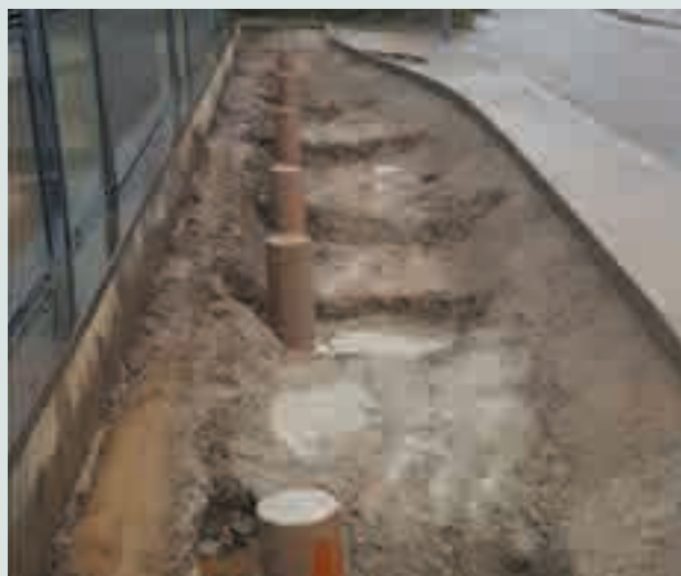
Réaménagement de la devanture du CPAS – subside SPW